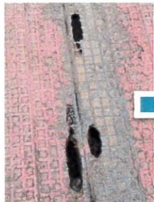
安全対策(補修) ↑ビフォー