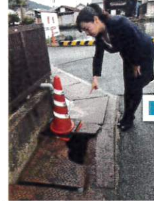
溝蓋の補修・竹屋町 ↑ビフォー